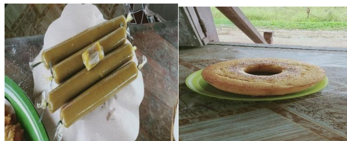
Gambar 10: Cake labu

Bahan: labu madu, air, tepung terigu, gula, blueband, wijen, pengembang, telur, minyak goreng. Cara.semua bahan.dicampur dan di uleni hingga bisa di bentuk sesuai selera, selanjutnya di masukkan ke air dan di ayak dalam wijen. Sehingga wijen lengket di adonan. Selanjutnya di goreng, dan siap dikonsumsi.