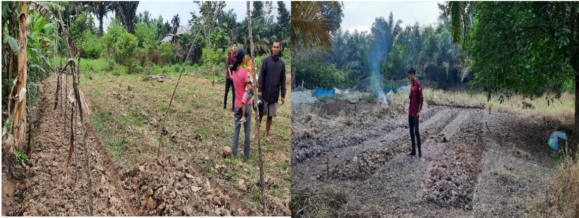
Gambar 3: Prsiapan lahan dan pemupukan