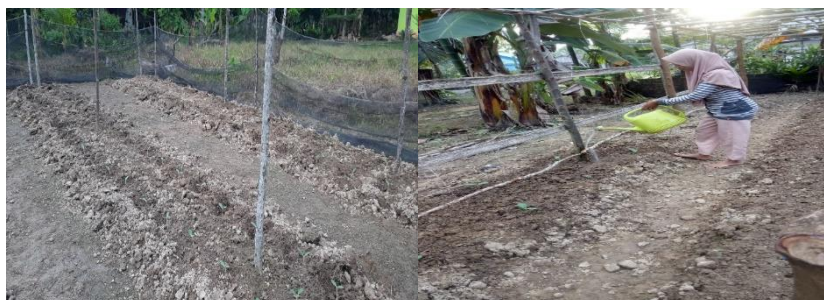
Gambar 5: Pembibitan benih labu madu

Kegiatan berikutnya adalah penyemaian tanaman labu madu setelah berumur 2 minggu atau tinggi tanaman mencapai sekitar 10 cm. Jarak tanam 1 x 1 m. Dilakukan peyiraman 2 kali sehari setiap hari. Dibuatkan para-para net jaring (paranet) untuk merambatnya tanaman labu madu.