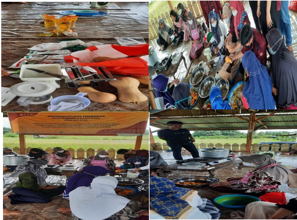
Gambar 7: Pelatihan membuat produk labu.

Berikut hasil Pelatihan membuat 1. Ciput labu, 2. Cake labu