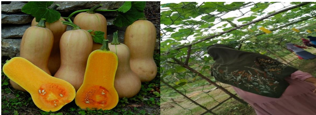
Gambar 6: Panen labu madu

Labu madu dapat dipanen setelah tanaman berumur sekitar 85 sampai 90 hari. Hal ini bisa ditandai dengan ciri-ciri tangkai buah bagian pangkal sudah berubah warna, dari warna hijau berubah menjadi warna coklat, warna buahnya juga berwarna coklat mengkilap. Ciri buah labu yang masak adalah dengan menjentikkan kuku tangan pada labu, jika tidak berdenting maka pertanda labu sudah masak. Bilaslah kotoran yang menempel di permukaan kulitnya. Simpanlah buah yang telah dipetik di tempat yang sejuk dan kering. Labu madu dapat bertahan hingga beberapa bulan.