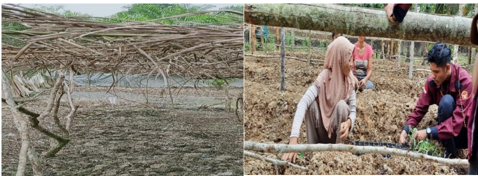
Gambar 4: Pembibitan benih labu madu

Pembibitan benih labu madu dilakukan di salah satu petak, untuk kebutuhan sebanyak 10 petak. Bibit benih bersertifikat dibeli dari toko pertanian, agar buah yang dihasilkan berkualitas. Benih (biji) ditanam dengan kedalaman 2,5 cm selama 2 minggu, disiram setiap hari. Dibuat timbunan dengan tinggi sekitar 7,6 cm untuk setiap labu, ditanam 4-5 biji/lubang. Tutuplah biji dengan tanah dan tekan-tekan dengan lembut.