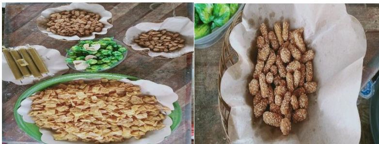
Gambar 9: Hasil olahan labu "ciput labu madu"

Berikut hasil Pelatihan membuat 1. Ciput labu, 2. Cake labu