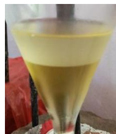
Gambar 3. Produk transesterifikasi

Pada Gambar 2 reaksi antara katalis basa (NaOH) dengan alkohol (MeOH) akan menghasilkan gugus metoksida yang berperan sebagai nukleofil pada reaksi transesterifikasi. Ion metoksi akan menyerang karbon karbonil molekul trigliserida dan membentuk intermediet tetrahedral. Langkah selanjutnya merupakan pembentukan alkil ester dan anion digliserida. Akhirnya, katalis akan mengalami deprotonasi dan bereaksi dengan ion digliserida untuk menghasilkan molekul digliserida yang siap bereaksi dengan molekul alkohol lain dan mengubah katalis basa ke bentuk awal 14 . Hasil dari proses transesterifikasi dapat terlihat pada Gambar 3 berikut.