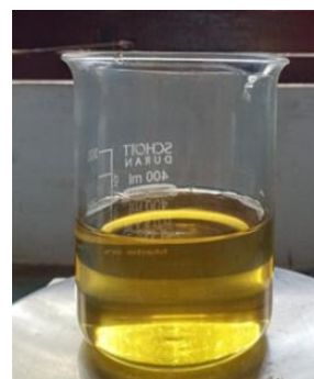
Gambar 1. Ekstrak Minyak feun kase

Volume pelarut yang direndam merupakan variabel yang dapat mempengaruhi koefisien perpindahan massa 10 . Volume pelarut dan berat bungkil dalam maserasi minyak feun kase berdampak terhadap rendemen minyak yang diperoleh. Dari hasil penelitian pada Tabel 1 terlihat bahwa proses maserasi menggunakan volume pelarut dan berat bungkil volume pelarut yaitu 500:500 (w/v) dan 1500:1000 (w/v) memberikan rendemen yang hampir sama. Volume pelarut yang lebih kecil dari berat bungkil memperoleh rendemen yang lebih kecil. Semakin tinggi volume pelarut yang digunakan akan melarutkan semakin banyak minyak di dalam bungkil feun kase sehingga semakin besar rendemen minyak yang diperoleh. Perlakuan optimum ekstraksi minyak feun kase dengan waktu 60 menit yaitu dengan volume pelarut 1500 ml dan berat bungkil 1000 gr. Perendaman maksimal dilakukan sebanyak lima kali sampai bungkil menjadi kering dan tidak berminyak serta perendaman kelima kalinya menghasilkan minyak dengan jumlah yang lebih kecil. Minyak feun kase dipisahkan dari pelarut petroleum eter menggunakan destilasi sederhana dan pemanasan pada hot plate . Minyak feun kase yang dihasilkan pada penelitian ini berwarna kuning kemerahan ( Gambar 1 ). Hal ini disebabkan oleh adanya senyawa karotenoid yang merupakan hidrokarbon dengan ikatan tidak jenuh, serta adanya pemanasan pada minyak dapat mengurangi warna merah pada minyak karena karotenoid tidak stabil pada suhu tinggi 11 .