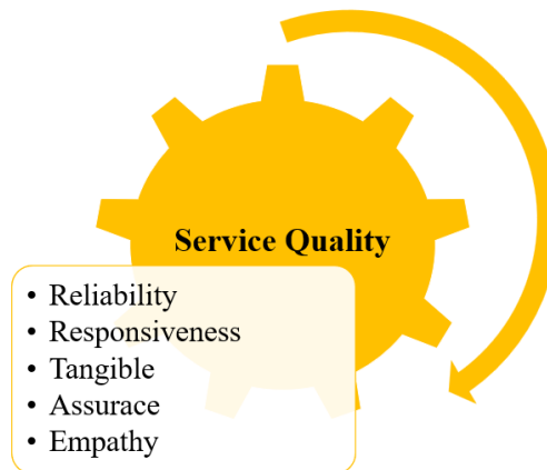
Gambar 2. Frame Work Dimensi Kualitas Pelayanan

Empati dimaknai sebagai kemampuan organisasi dalam memberikan perhatian kepada penerima layanan. Bentuk-bentuk empati biasanya dimunculkan antara lain: upaya menjalin komunikasi serta tidak membedakan dalam memberikan layanan bagi setiap pelanggan (Kalia et al., 2021). Dimensi ini juga fokus dalam memberikan perhatian secara individu kepada pelanggan dengan berupaya memahami keinginan yang berbeda-beda. Organisasi diharapkan memiliki pengertian dan mengetahui profil pelanggan, memahami kebutuhan secara spesifik, serta memiliki waktu penyelesaian yang baik bagi pelanggan.