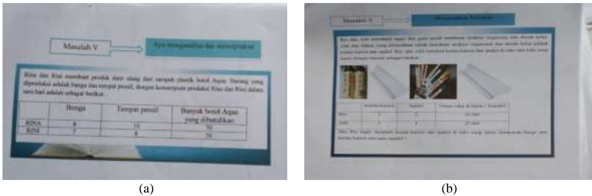
Gambar 3. Masalah V sebelum dan setelah revisi

Gambar 2a menunjukkan kesalahan dalam tahap menyimpulkan dan peneliti telah melakukan perbaikan sesuai saran validator yang bisa dilihat pada gambar 2b. Terdapat kesalahan lain sebelum dan setelah direvisi seperti pada Gambar 3.