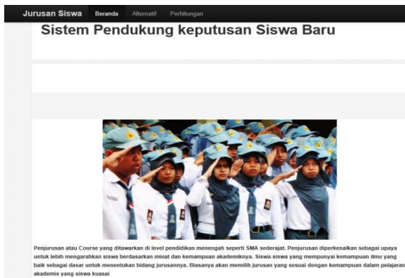
Gambar 3. Halaman Beranda