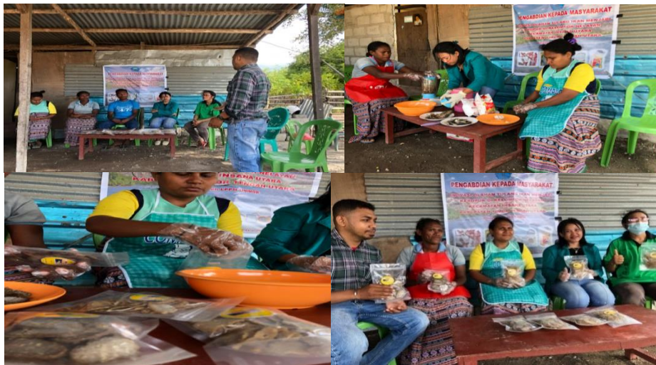
Gambar 3. Pendampingan Pengolahan Kerupuk bagi Bapak dan Ibu Nelayan