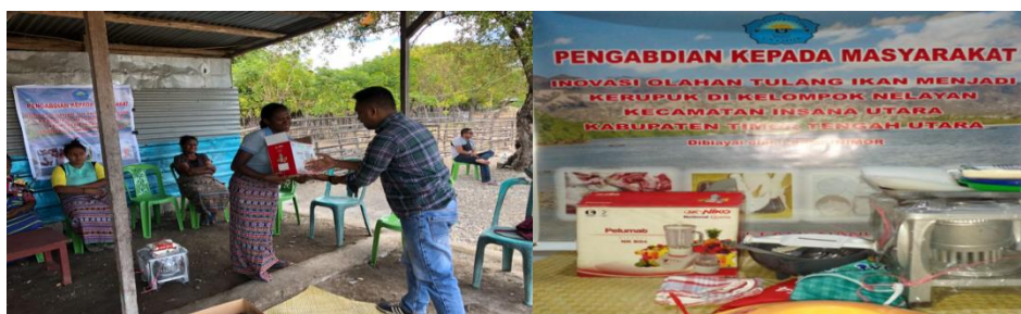
Gambar 2. Penyerahan bantuan alat dan bahan pada mitra

Bantuan bersifat melengkapi peralatan yang telah dimiliki oleh mitra, yang dirasa kurang memadai. Bantuan yang diberikan kepada mitra kegiatan pengabdian berupa timbangan, blender, panci, alat pressto, plastik pembungkus, siller dan alat pemotong kerupuk. Setelah penyerahan bantuan, dilanjutkan dengan tahapan pelaksanaan pelatihan. Tahap pelatihan dilaksanakan selama tiga hari dari tanggal 7 sampai dengan 9 Juni 2022 yang tersaji pada Tabel 2.