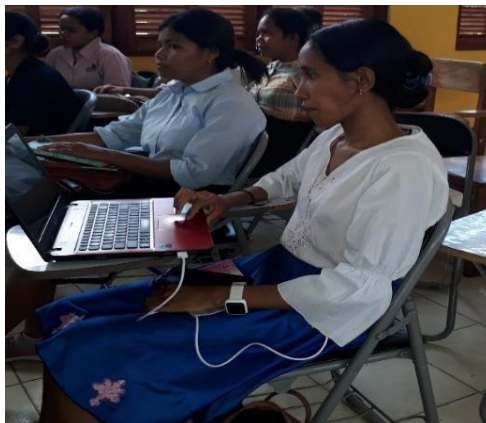
Gambar 4. Mahasiswa Praktek Tes Submit Artikel Jurnal

Setelah dilakukan tahap penskoran nilai mahasiswa maka dilakukan analisis lalu diperoleh nilai rata-rata yang dapat dilihat pada tabel 2. Pada tabel 2, hasil pelatihan Open Journal System mengalami peningkatan dari nilai rata-rata pre-test 24.38 % dan post-test 81.25 %. Dengan demikian, dapat dikatakan adanya peningkatan nilai mean antara pre-test dan post-test. Hasil ini menunjukkan bahwa pelatihan Open Journal System dengan metode demonstrasi berpengaruh positif terhadap mitra yang diabdikan. Untuk mengevaluasi signifikansi dari peningkatan nilai pengetahuan tersebut, maka dilakukan uji – t dengan hipotesis nol ( H_0 ) bahwa tidak ditemukan perbedaan signifikan antara nilai pengetahuan pretest dan posttest, serta hipotesis alternatif ( H_a )