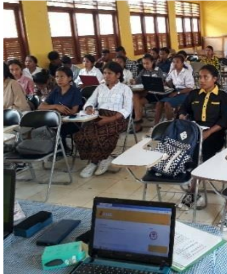
Gambar 1. Pemaparan Cara Buat Akun Open Journal System dengan Metode Demonstrasi