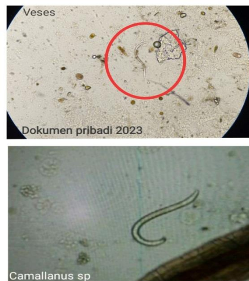
Gambar 2. Jenis parasit Camallanus sp

Camallanus sp. ditemukan pada veses karena parasit ini merupakan cacing endoparasit yang hidup dan menetap pada organ dalam ikan Camallanus sp. merupakan cacing nematode yang ditemukan pada veses ikan. Cacing ini. memiliki bentuk tubuh silindris.